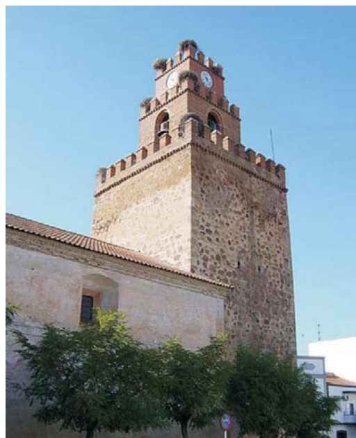
Torre templaria de la Iglesia de San Pedro Apóstol

El actual retablo mayor, también de estilo barroco, data de la primera mitad del siglo XVIII. Sorprende por su policromía y sobre todo, por su soberbia arquitectura de originales estípites sobre bases cilíndricas. Cerrado en 'casarón', y coronado por la figura del Padre Eterno, se enseñoorea, mediante este recurso, de toda la altura disponible en la capilla. Se presume que contó con uno de los grandes maestros entalladores del momento, Sebastián Jiménez, autor también del retablo mayor de la Iglesia parroquial de Fuente del Maestre. Artista itinerante, tomó definitiva vecindad en Aceuchal donde había contraído matrimonio hacia 1730, falleciendo en el mismo lugar en diciembre de 1761.