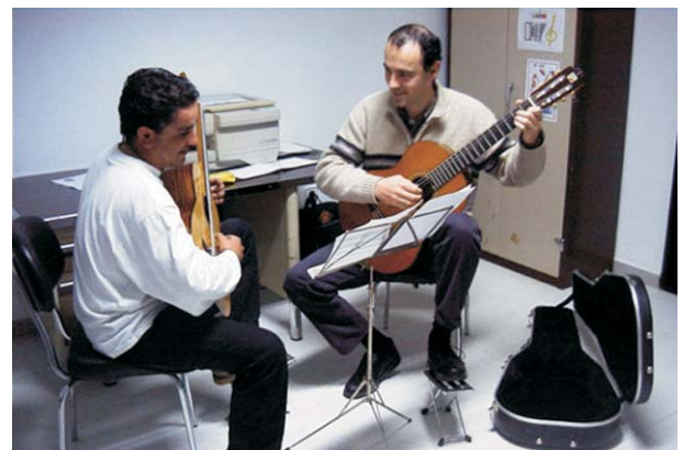
Escuela Municipal de Música y Danza

Fueron incorporándose a las labores docentes profesores y profesoras de distintas asignaturas