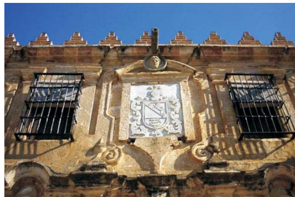
Escudo casa solariega de los Salamanca

El poblado se fijó en la encrucijada de los caminos entre Almendralejo Villalba de los Barros, Villafranca de los Barros y Solana de los Barros, en el eje de la Cañada Real Leonesa, surgiendo su foco inicial en la zona que hoy corresponde a los Cuatro Caminos, las Cañadas y La Lancha.