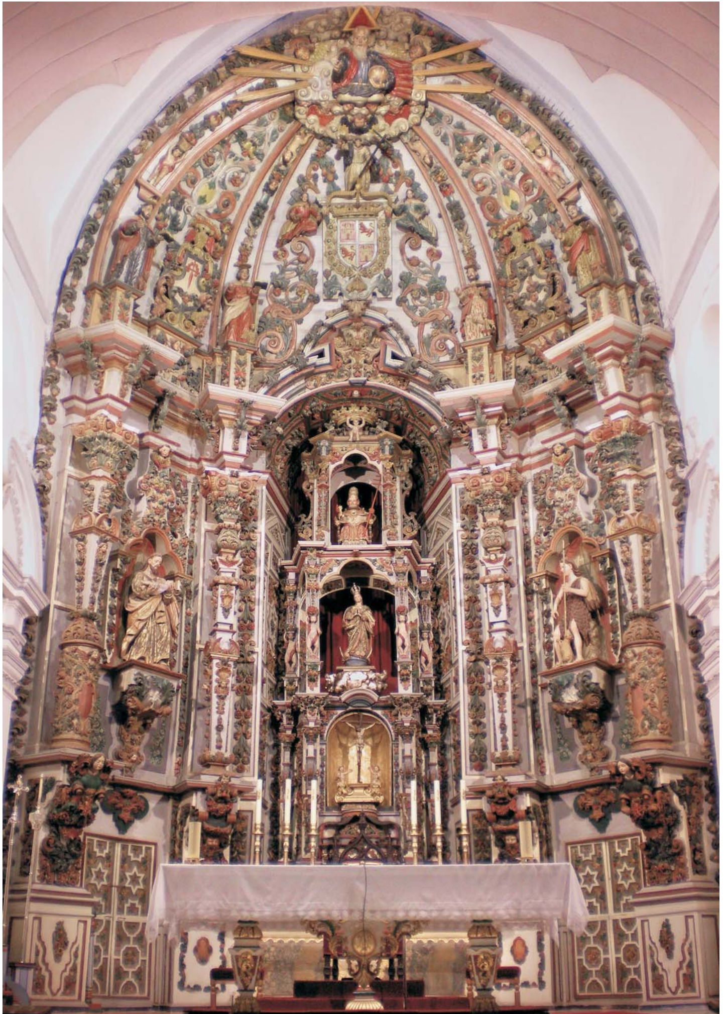
Altar Mayor de la Iglesia Parroquial San Pedro Apóstol