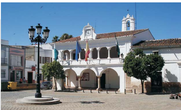
El Ayuntamiento de Aceuchal, considerado de los más bellos de la región, fue un antiguo convento.

En cuanto al movimiento asociativo, está documentada la fundación de la Sociedad de Auxilios Mutuos que en 1901 se convirtió en el Obrero de Aceuchal. En 1905 se creó la Comunidad de Labradores y en julio de 1931 la Agrupación Patronal de Aceuchal.