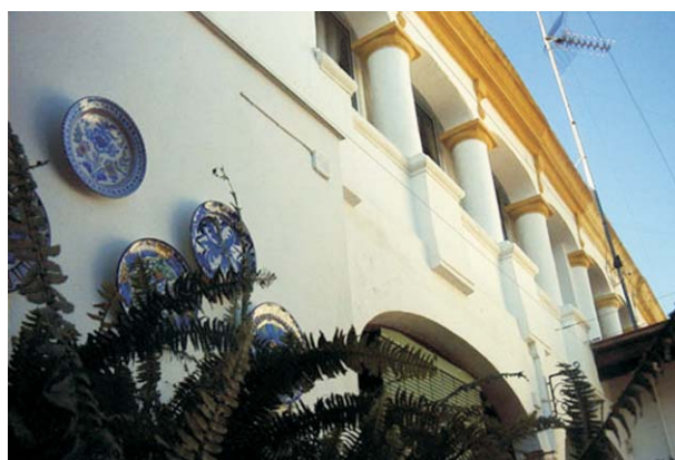
Detalle patio interior

Al exterior, estas casas se distinguen por el predominio del muro sobre los vanos. Puertas y ventanas suelen presentar atractivos recercos, multiplicándose otros componentes formales, como hermosas rejas que adornan las fachadas en las que proliferan las ventanas y balcones.