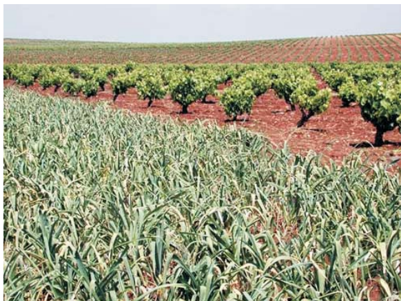
Cultivos típicos: Ajo y Vid

A pesar de la grave contaminación que asola al río Guadajira, aún remontan las aguas, más limpias en primavera, especies endémicas como pardillas y calandinos; pero una especie protegida, el jarabugo, parece haber desaparecido definitivamente.