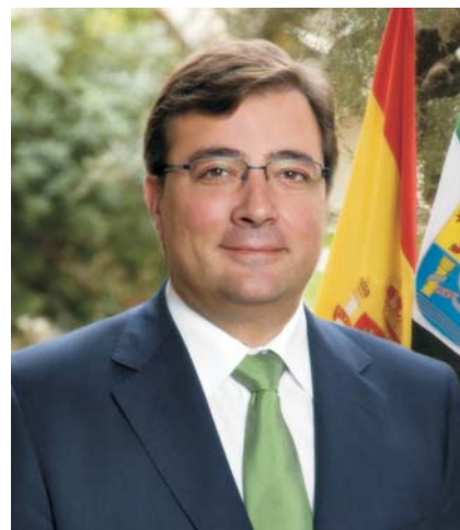
Guillermo Fernández Vara Presidente de la Junta de Extremadura

En todas las ocasiones, esas canciones llegan en el momento adecuado para levantarnos el ánimo cuando todo parecía indicar que nuestro día se iría al cesto de la basura. Eso sucede cuando escuchamos a alguna de las más de 75 Corales que componen la FECOEX y en concreto al grupo polifónico de Aceuchal.