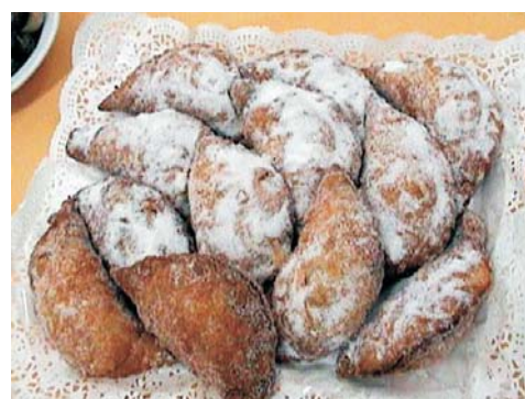
Empanadas de Bizcocho

Coger una bolita de envoltura y estirar con el rodillo hasta que la masa queda muy fina, echar una cucharada de bizcocho, doblar y recortar con el cortapastas dando forma de media luna. Freír en abundante aceite, no muy caliente. Pasar por azúcar.