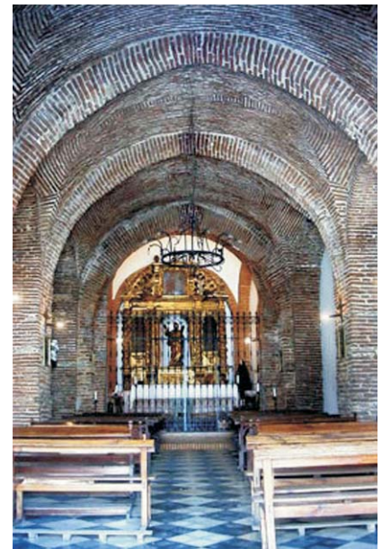
Ermita de San Andrés

Producto especialmente característico de Aceuchal es el ajo, del que a su vez resulta inseparable la figura del ajero. En homenaje a tan significativa figura, el pueblo tiene un monumento dedicado al "ajero", expresiva obra en bronce de Fulgencio León Manchego, erigida en 1985. En conexión con el ajo, los paisanos de Aceuchal son conocidos bajo el gentilicio de "piporros".