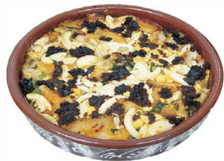
Sopas de Antruejo

Al caldo se le machan dos ajos, pimienta negra y un chorrito de vinagre. Se echa todo el caldo y se pone a gratinar el horno, hasta que esté doradito. Se esparce por encima huevo cocido.