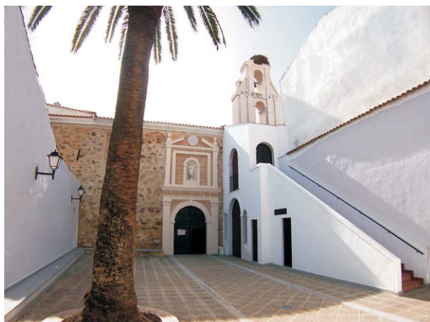
Patio del Convento de las Dominicas (S. XVII)

También es de significar en esta localidad el que fuera convento de Religiosas Dominicanas con el título de Nuestra Señora de los Remedios, que ha sido la única parte del conjunto monacal que tras la Desamortización del siglo XIX se ha conservado hasta nuestros días.