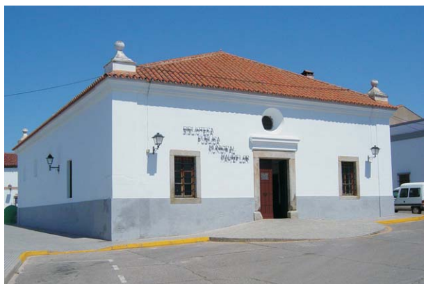
"La Panera", antiguo pósito nacional, hoy Biblioteca

La biblioteca contaba entonces con 2.400 volúmenes y con una superficie de 100 metros cuadrados. Dentro del fondo bibliográfico cuenta con la obra de Mahizflor, autografiada por ella, y con la pluma y el bolígrafo con los que la autora escribió el libro "Aceuchal, apuntes para la historia de mi pueblo".