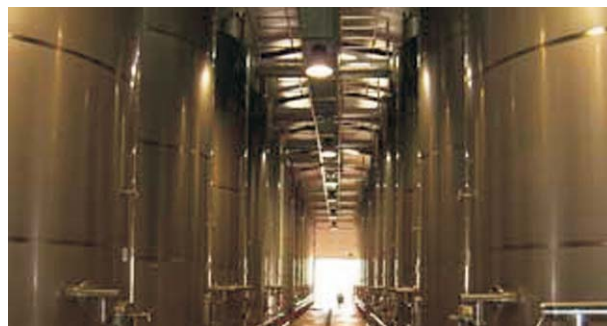
Industria del vino: Sociedad Cooperativa "Ntra. Sra. de la Soledad", de las mayores de la zona.

El sector primario es el principal motor de la economía local. Las explotaciones agrarias ocupan la mayoría de la superficie del término municipal y los cultivos dominantes en cuanto a números de hectáreas son el viñedo y el olivar, aunque hay que hacer especial mención por lo importante y exclusivo de su producción al cultivo del ajo, que se ha convertido en una seña de identidad local.