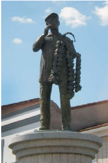
Monumento al Ajero

De sobresaliente atractivo plástico resulta el Ayuntamiento, uno de los más hermosos, quizá de la región, en cuya variada composición destacan sus soportales y galerías. El edificio, identificado como un antiguo centro religioso conectado con el convento franciscano de Montevirgen de Villalba, fue restaurado con notable acierto en 1.920, presentándose hoy impecablemente enalado y cuidado.